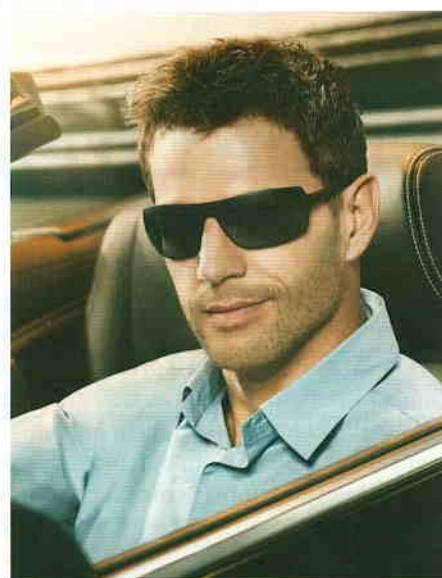
Jaguar-Mod. 37539 ( www.menrad.de ).

Eine klare, markante Formensprache prägt den Charakter des sportiven Sonnenbrillenmodells 37539 von Jaguar. Das Design ist wohl durchdacht, edel und wie maßgeschneidert für maskuline Ansprüche. Die Fassung ist in drei Farbkombinationen erhältlich: mattedes Anthrazith/hellgraue Bügel/grüne Scheiben, mattedes Anthrazith/grau Scheiben und mattedes Schwarz/grau Scheiben.